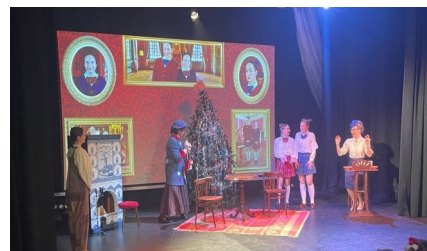
В театре «По правде»

В Парке есть лаборатория, в арсенале которой десять познавательно-развлекательных программ из разных областей науки. Вы можете выбрать любую! Я выбрал программу «4 стихии» и не пожалел. Не буду рассказывать всех секретов, скажу только, что после Парка я точно понял, что наука бывает без скуки!