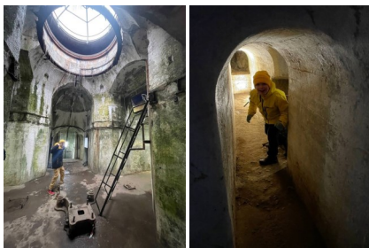
Невероятно интересные катакомбы форта «Риф»

В музее можно рассмотреть диораму «Бой со шведским десантом», орудия и экспонаты, которые нашли на острове. Во втором комплексе представлен интерактивный выставочный проект «Нас бросала молодость на кронштадтский лёд...», посвящённый восстанию 1921 года. Затем можно увидеть, в каких условиях работали медики (осторожно, слабонервным смотреть запрещается!). И самое интересное — вы сможете побродить по длинным коридорам катакомб. Здесь «страшно» интересно!