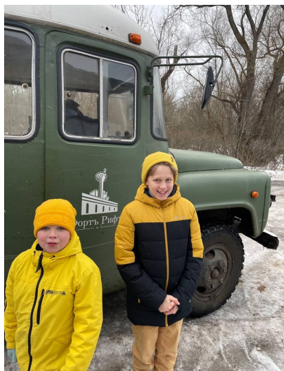
Едем на форт «Риф»!

Когда-то это было закрытое место, военная часть. Но с 2020 года форт стал открыт для посетителей. Здесь можно найти много всего интересного: наблюдательные пункты, доты, огромные прожекторные шахты, лабиринты казематов, подземные галереи. Но давайте по порядку.