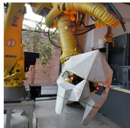
Робот, который играл в театре

Ещё есть промышленный робот, он участвовал в театральных постановках и в регистрации брака одной из сотрудниц Планетария.