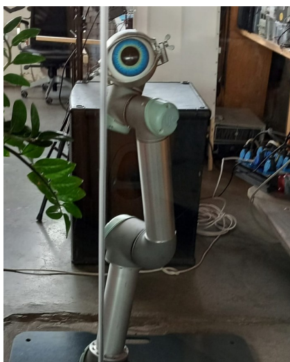
Робот с человеческим именем Юра

Другой робот по имени Юра является многофункциональным: у него есть глаз, в который закладывают разные программы, и Юра их выполняет.