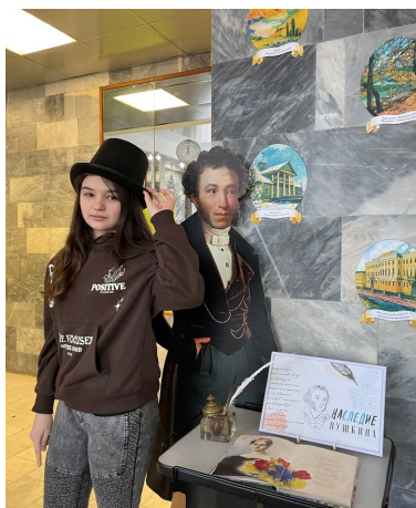
Выставка «Наследие Пушкина»

«Они изменили историю» (о выдающихся женщинах), «Наследие Пушкина».