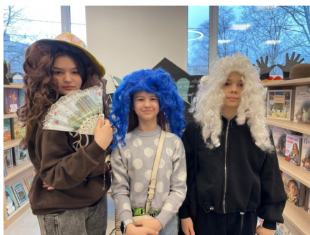
Интерактивная выставка «Играем в театр»

Нас покорила передвижная интерактивная выставка «Играем в театр», подготовленная сотрудниками Музея театрального и музыкального искусства и созданная художницей Олесей Гонсеровской. С помощью простых вещей, картонных конструкций, театрального реквизита, масок, кукол нам рассказывают об удивительном театральном мире. Всё можно трогать, двигать, крутить и примерять! Это и выставка, и игровая площадка, и музей, и театр.