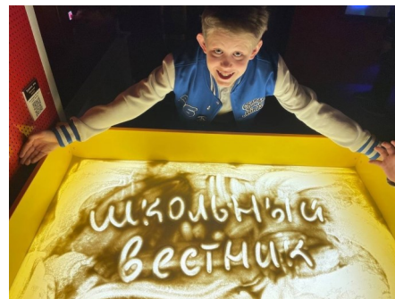
В «Парке чудес Галилео»

В Парке есть лаборатория, в арсенале которой десять познавательно-развлекательных программ из разных областей науки. Вы можете выбрать любую! Я выбрал программу «4 стихии» и не пожалел. Не буду рассказывать всех секретов, скажу только, что после Парка я точно понял, что наука бывает без скуки!