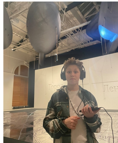
На выставке в «Манеже»

Всем, кто интересуется историей нашего города, рекомендуем посетить современную выставку, приуроченную к 80-летию полного освобождения Ленинграда от блокады. Это масштабный проект, который расположился в историческом центре Санкт-Петербурга, в центральном выставочном зале «Манеж».