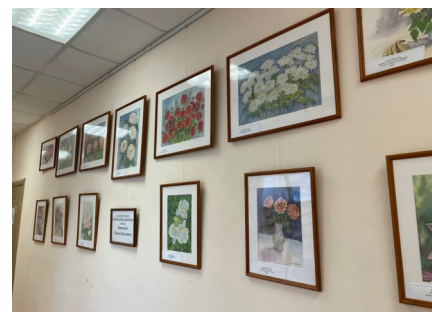
Выставка «Таинство цветов»

В холле представлена выставка картин «Таинство цветов» художницы Елены Васильевны Ворониной. На выставке находятся двадцать две картины, написанные акварелью. Всё-таки цветы — удивительные создания природы. В них какая-то абсолютная красота и гармония.