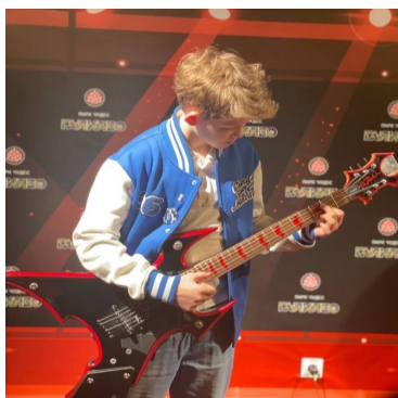
В роли музыканта

Когда мы вошли в Парк, нас окружили шум, стук и крики. Но потом мы освоились: протестировали себя на скорость реакции, сочинили стихи с автоматическим стихоплётом, отгадали столицы, попробовали себя в роли музыкантов, запустили в плавание кораблик, испытали свой вестибулярный аппарат в лабиринтах. И это ещё не всё!