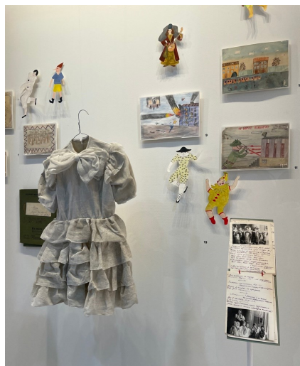
Детское платье из бинтов. Рисунки детей во время блокады

Во время экскурсии мы побываем на улице, в квартире, кинотеатре, Эрмитаже, лаборатории, детском саду, библиотеке, театральной гримёрке, мастерской художницы, физкультурном зале, филармонии. Мы услышим историю воспитательницы, которая хотела порадовать своих воспитанников и добыть им ёлочку на Новый год. Её не было сутки, и никто не знал, какие усилия ей пришлось приложить, чтобы дети справились праздник так, как положено. Мы увидим рисунки, которые делали дети во время блокады.